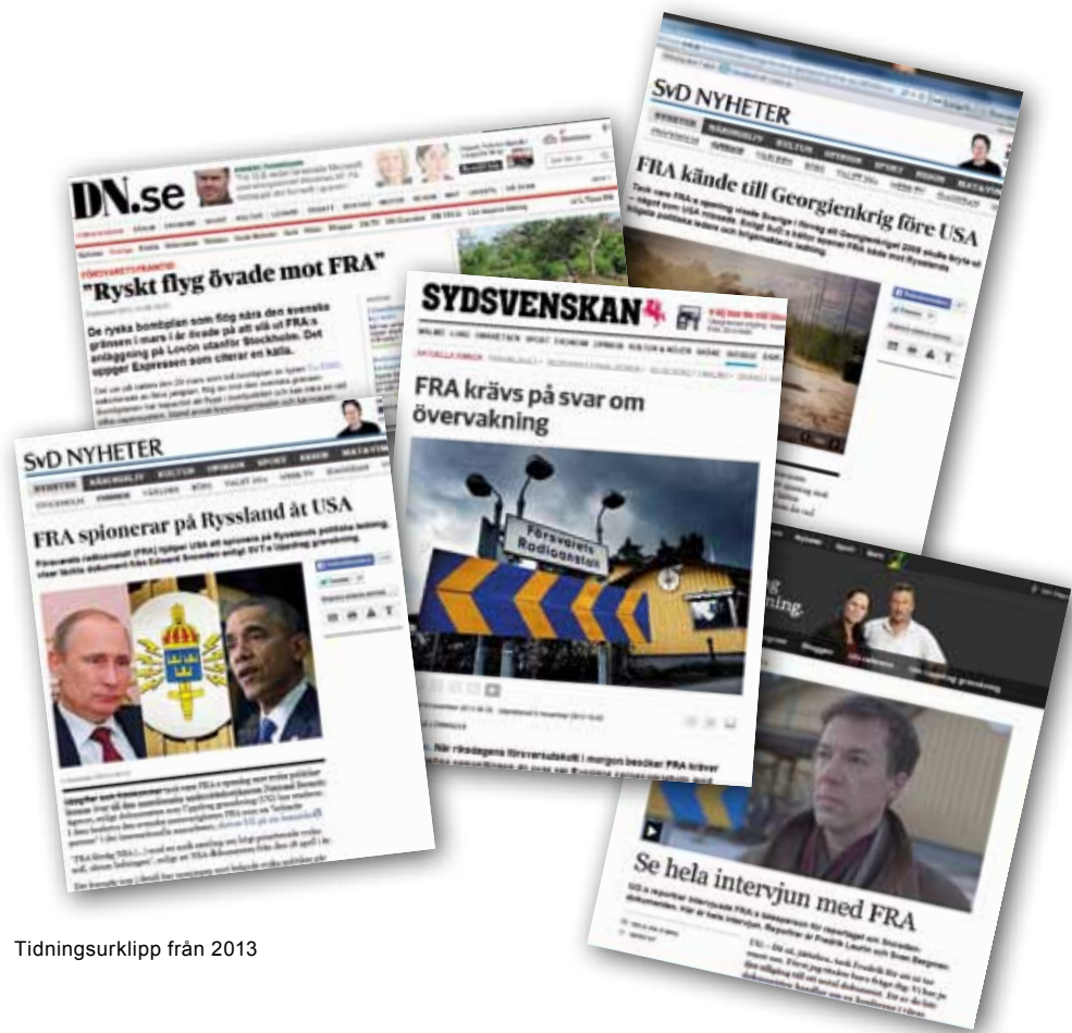
Tidningsurklipp från 2013