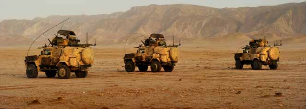
AFGHANISTAN. Soldater från den svenska kontingenten under en operation i området West of MeS.